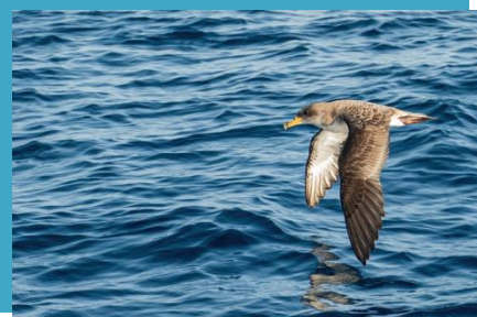
Le Puffin des Baléares