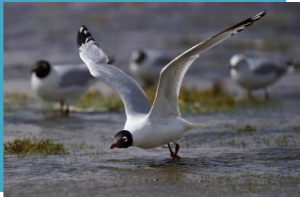
La Mouette Rieuse