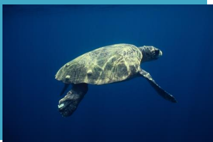
La Tortue caouanne